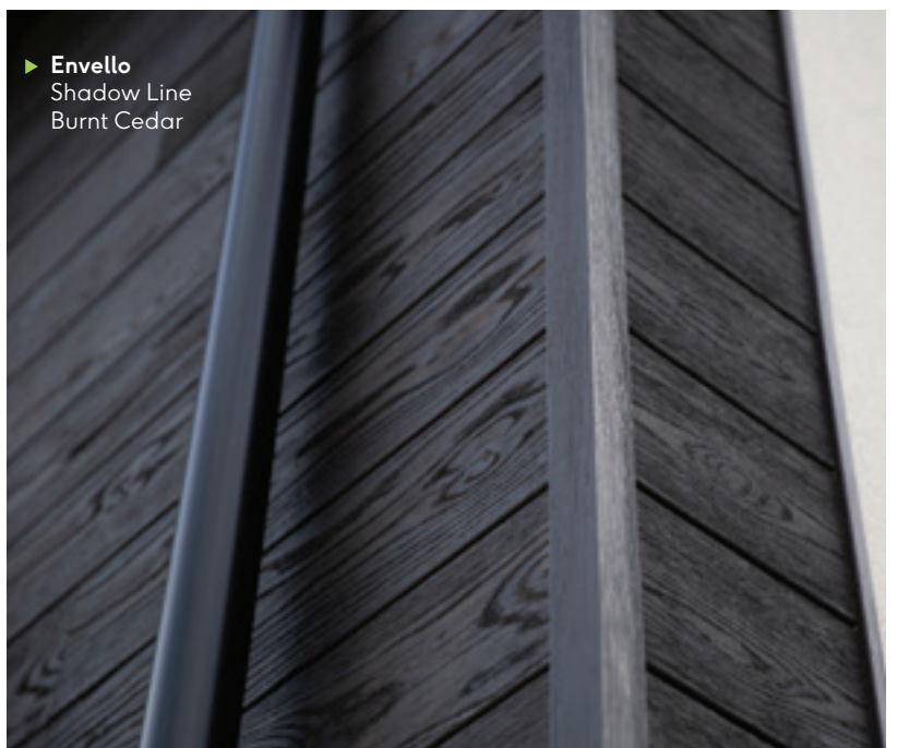
▶ Envello Shadow Line Burnt Cedar