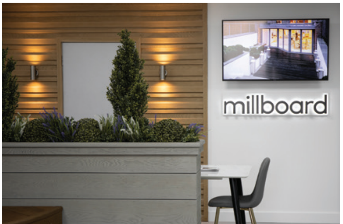
Showroom van Millboard ▶ Midlands Design Hub Bodmin Road, CV2 5DB

In iedere showroom staan opvallende displays, met voorbeelden van de vele creatieve manieren waarop u Millboard kunt gebruiken. Talloze innovatieve legstijlen en alternatieve toepassingen ervaart u in onze showrooms. Vraag ons naar de actuele locaties bij u in de buurt.