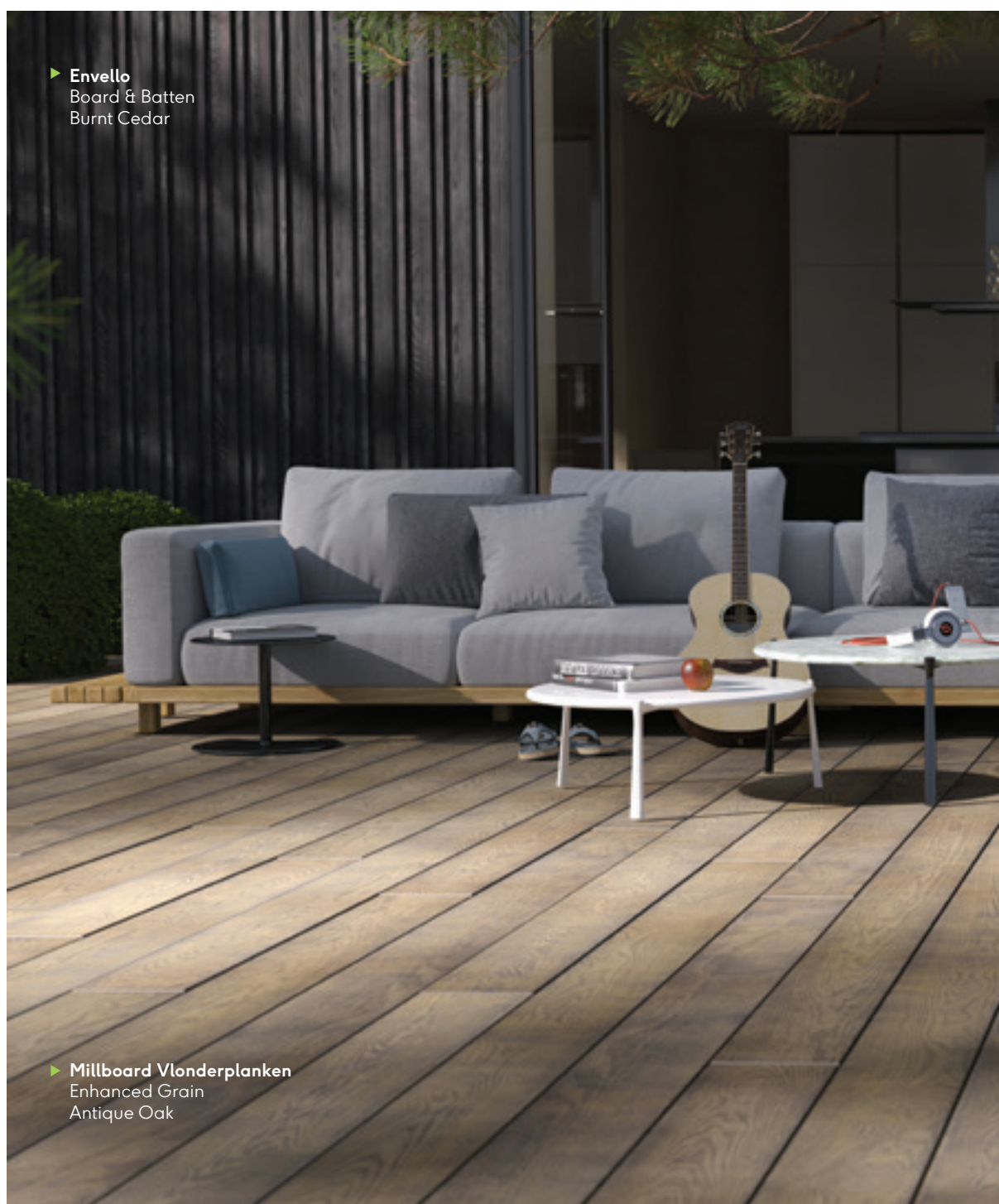
► Envello Board & Batten Burnt Cedar