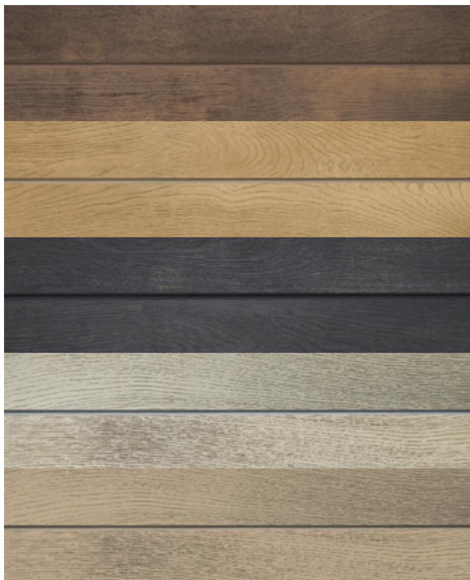
◀ Antique Oak MCG360A

De schuine hoeken van onze panelen voorkomen dat er water tussen de twee profielen komt. Ook kan regenwater hierdoor niet over het oppervlak van de gevelbekleding spoelen. De inkeping tussen de panelen versterkt het individuele nerfpatroon per paneel.