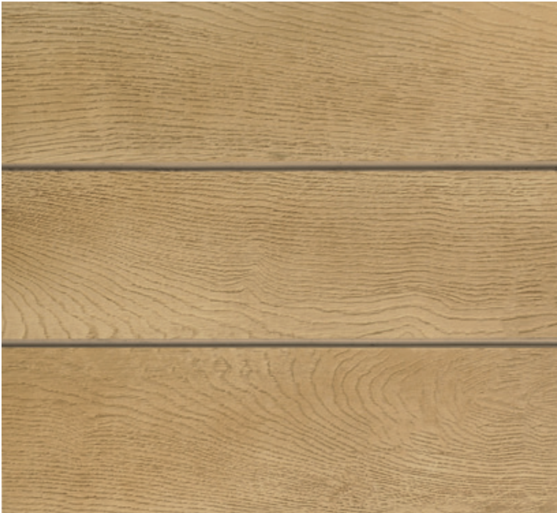
◀ Envello Shadow Line Golden Oak

Gemaakt om perfect imperfect te zijn We kleuren Envello-gevelbekleding met de hand in, omdat we daarmee het uiterlijk realistischer maken.