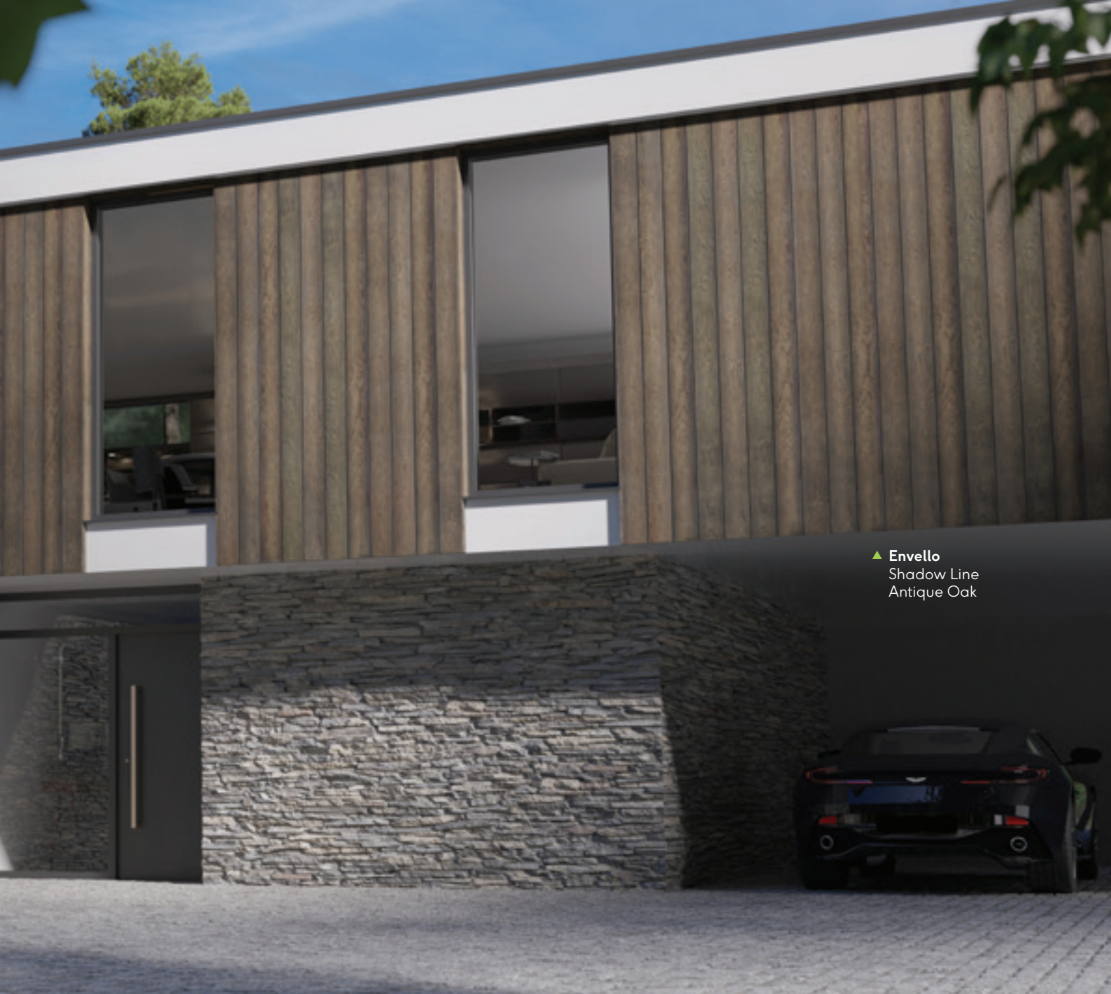
▲ Envello Shadow Line Antique Oak