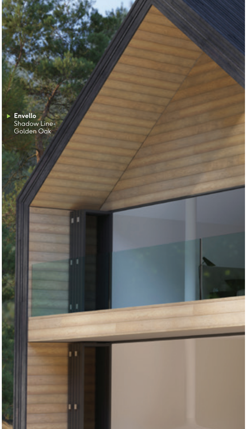
▶ Envello Shadow Line- Golden Oak