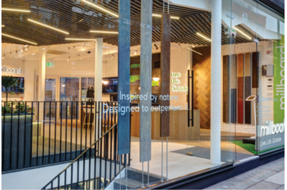
Showroom van Millboard ▶ London Design Hub Goswell Road, EC1V 7EN