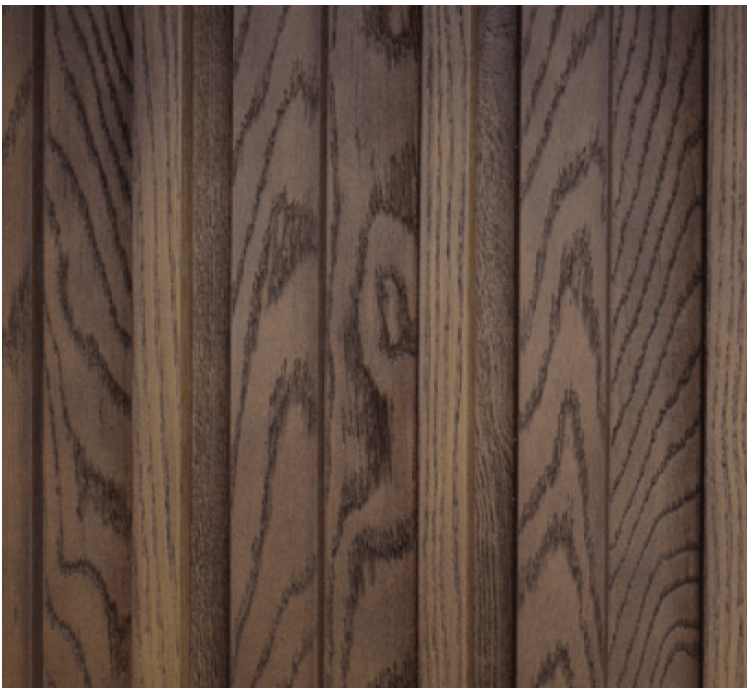
◀ Envello Board & Batten Antique Oak

Gemaakt om perfect imperfect te zijn We kleuren Envello-gevelbekleding met de hand in, omdat we daarmee het uiterlijk realistischer maken.