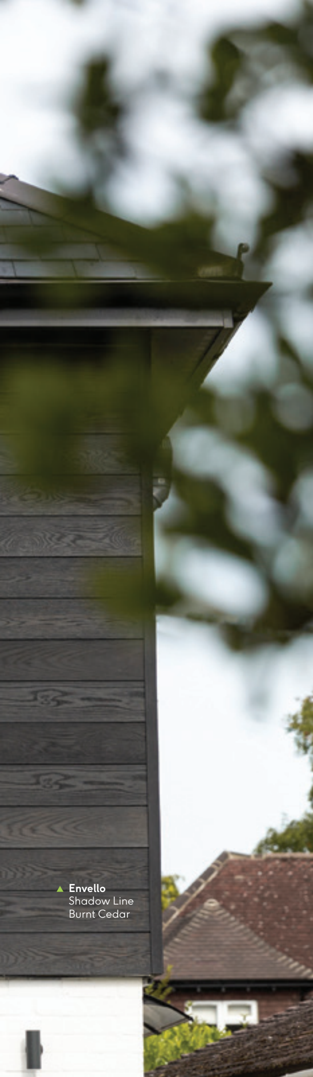
▶ Envello Shadow Line Burnt Cedar