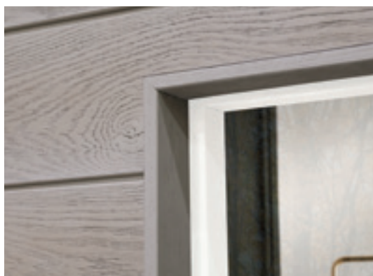
▲ Envello Shadow Line Smoked Oak

Met hoekprofielen en boeiboorden verfraait u bijvoorbeeld hoeken van gebouwen, maar ook raam- en deurkozijnen. Onze profielen selecteerden we speciaal voor een extra aantrekkelijk, strakker uiterlijk én een eenvoudiger en dus snellere montage.